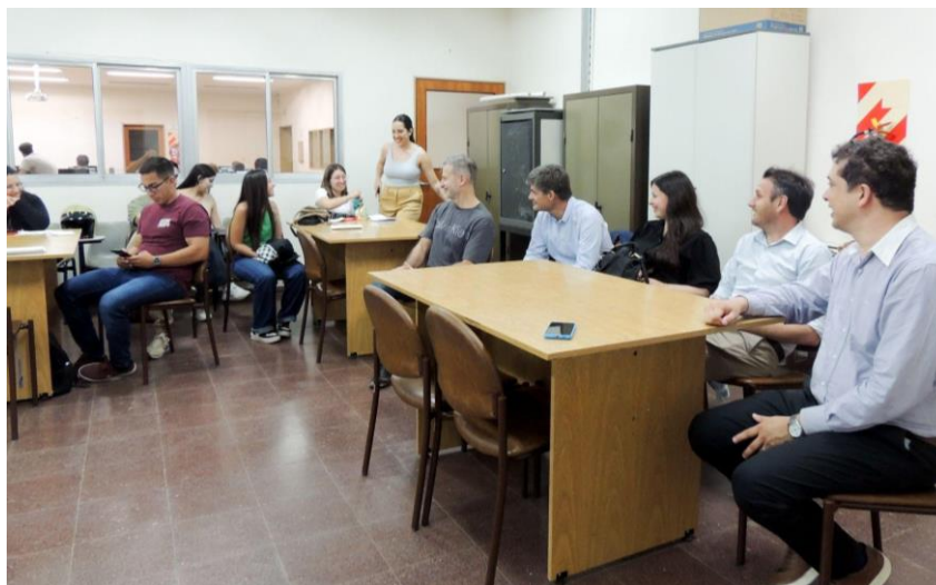
Imagen 2: Intendente y gabinete junto a miembros de cátedra y estudiantes

Durante la exposición, los alumnos presentaron diagnósticos y propuestas basadas en evidencia —como la implementación de un sistema de recaudación digital o la elaboración de manuales de procedimientos—, recibiendo retroalimentación directa de los funcionarios.