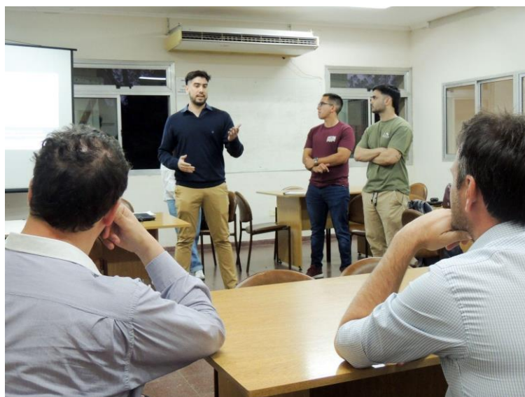
Imagen 3: Presentación de estudiantes del trabajo final

Para los estudiantes, este ejercicio reforzó competencias clave: desde la comunicación efectiva de hallazgos técnicos hasta la negociación de soluciones en contextos complejos. Las imágenes de la jornada (Imagen 3 y 4) capturan este intercambio, mostrando a los alumnos en un rol protagónico como puentes entre la academia y la gestión pública, y consolidando el proyecto como un modelo replicable para futuras intervenciones.