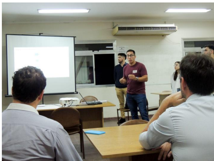
Imagen 4: Presentación de estudiantes del trabajo final