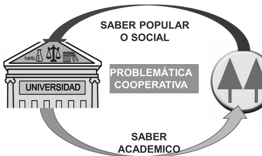
Figura 2- Articulación de saberes.

Bajo esta premisa los autores del trabajo nos propusimos abordar las problemáticas especiales de las cooperativas, siendo uno de los requisitos fundamentales la participación voluntaria de los actores sociales de las entidades del sector como contraparte del proyecto, y que involucre necesariamente su rol activo en la ejecución del mismo. Entendemos que no se conciben estas prácticas a modo de una consultoría profesional externa que realiza un relevamiento, analiza y propone una solución, sino que, por el contrario, requiere una articulación de saberes desde lo académico y lo social.